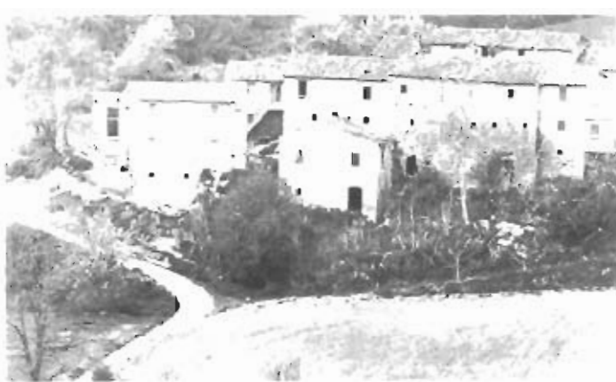
Fra le attività da incrementare vi è anche l'agriturismo.

Per quanto riguarda il turismo, voce importantissima nel nostro bilancio, abbiamo 16 progetti per un investimento di oltre 86 miliardi, dei quali 25 vanno all'agriturismo