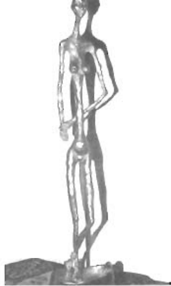
Mauro Crocetta - Attesa - Bronzo.

filigrana che Mauro Crocetta, sensibile ai momenti innovativi dell'arte, dà un contributo di partecipazione con poche (tre in tutto) e misurate sue sculture che offrono il segno, duttile e ricco, della sua vitalità d'oviziosa e geniale. Una lussureggiante aere e preziosa connota il bronzo "Attesa" (h. cm. 52) nel quale si misura, a nostro avviso, la più alta virtù e non solamente il virtuosismo di consumato artefice del Crocetta, per la trasparente capacità di cogliere, e comunicare, un brivido estetico espresso da una gestualità