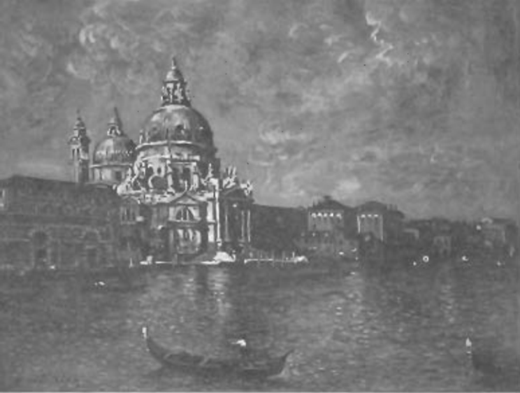
Giorgio De Chirico - Olio 40 x 50 - 1950.