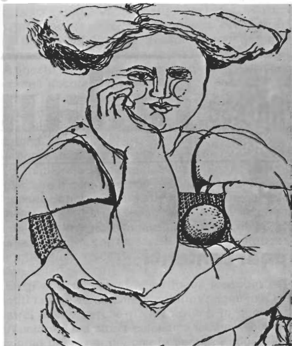
Anno 1971 Hic et nunc