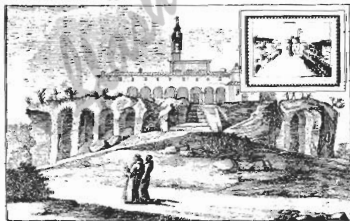
ASCOLI PICENO 25 MAGGIO 1998 71° GIRO CICLISTICO D'ITALIA TAPPA URBINO - ASCOLI CONFECOMMERCIO ASCOTOUR