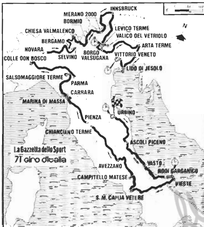
La planimetria generale del 71° Giro ciclistico d'Italia.