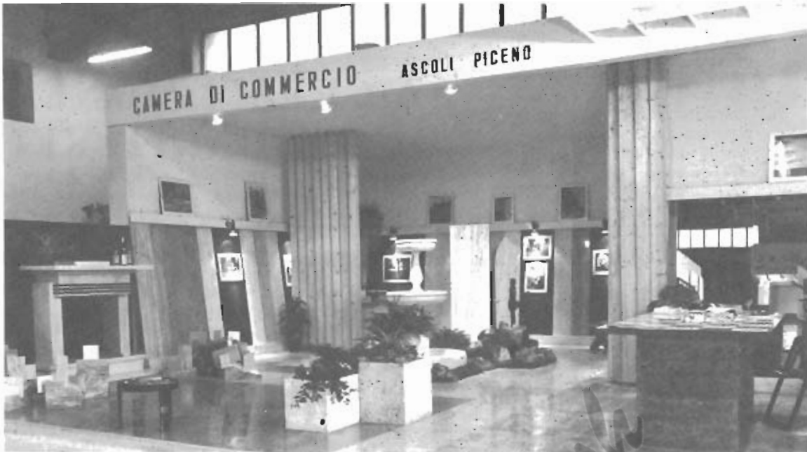
Lo stand della Camera di Commercio di Ascoli Piceno all'esposizione "Marmomacchine" a S. Ambrogio di Valpolicella (Verona).

"In Ascoli e in tutta la Regione Marche si sta vivendo per il 'travertino' una situazione paradossale. Infatti, mentre la Regione Sicilia in-