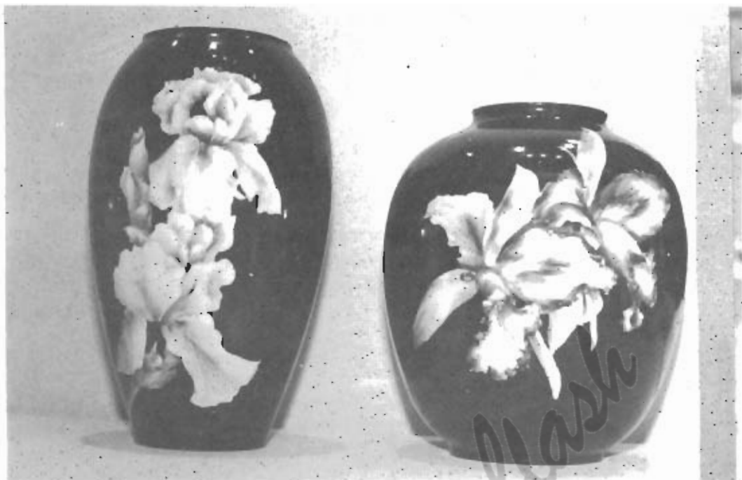
Alcuni eloquenti esempi di lavori realizzati dal laboratorio di porcellane artistiche "Il Borgo".

La qualità della porcellana, unitamente al pregio del de-