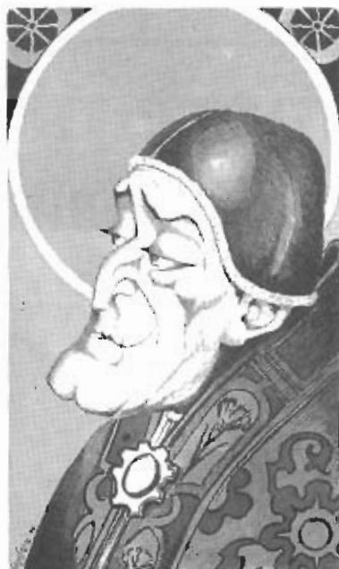
Alcune "immaginette" di "San Totò mira il tuo popolo", riprodotte in grandezza naturale