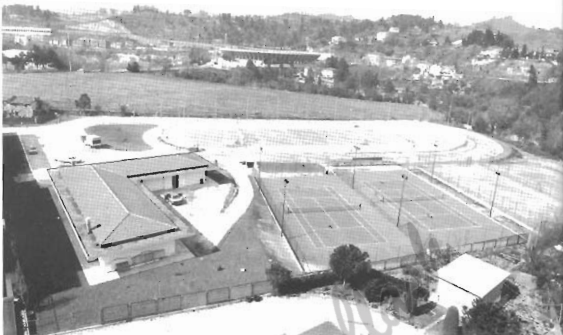
Panoramica del "Pattinodromo Piceno" zona Pennile di Sotto, oggi considerato uno dei migliori d'Italia. Valevole per manifestazioni ad ogni livello