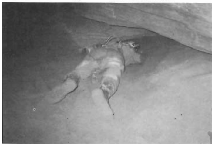
Un esploratore mentre si fa largo nella sabbia alla ricerca di un passaggio fra due ambienti collegabili