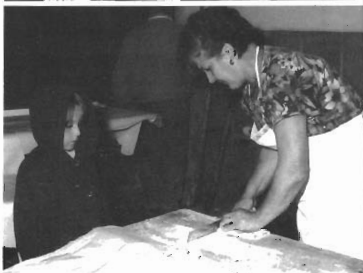
Sotto gli occhi di una "bambina allieva" si taglia la pannella avvolta per farne fettucine