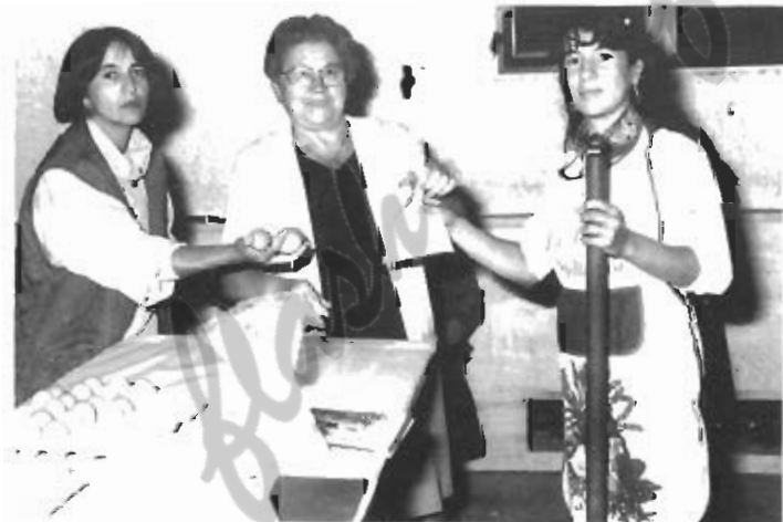
Sopra: ad ogni concorrente sono state consegnate quattro uova e un sacchetto di farina ■ Sotto: dopo aver rotto le uova si provvede ad impastare il tutto