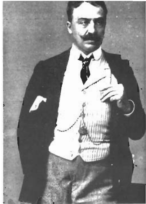
Giuseppe Sacconi nel 1904.

Anche fra tante difficoltà però, il Sacconi, allora, non si perse mai d'animo, cosciente della responsabilità sua verso l'Italia ed il mondo civile. Anche perché, fra i tanti avversari, ebbe valentissimi collaboratori ed amici come una schiera di giovani artisti che lo stimavano e che formarono una scuola chiamata, a buon diritto,