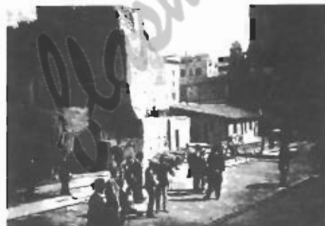
Vittorio Emanuele III con la missione giapponese in visita ai lavori.

Aquileia il 4 novembre 1921. E poi ancora le statue di bronzo dorato che raffigurano "L'Architettura", "La Musica", "La Scultura" e "La Pittura", opere squisite di Antonio Garella e di Lio Gangeri. Non manca, infine, la ricchezza del fregio a mosaico con le otto composizioni rappresentanti "La Forza", "La Fede", "Il Lavoro", "La Sapienza", di Giulio Bargellini e "La Legge", "Il Valore", "La Pace" e "L'Unione", del cremonese Antonio Rizzi.