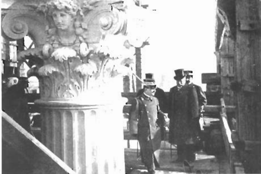
Vittorio Emanuele III in visita ai lavori.