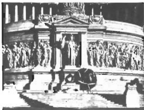
L'Altare della patria.