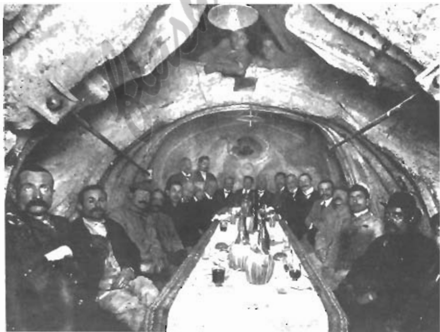
Una "bicchierata" offerta da Bastianelli ai suoi operai nel ventre del cavallo dopo la fusione del gruppo equestre.

Così scriveva infatti Angelo Conti sulla "Nuova Antologia" del 1 aprile 1904: "Al cospetto di un tale spettacolo e in mezzo a tali memorie il Conte Sacconi ha dovuto edificare il suo monumento. Ed è riuscito nella sua terribile impresa con piena vittoria. L'architetto doveva infatti edificare un monumento che, non solo esprimesse l'idea della Terza Italia, ma fosse degno di poggiare la sua base nell'area capitolina e di stare accanto al Campidoglio di Michelangelo, alla Chiesa di Ara Coeli,