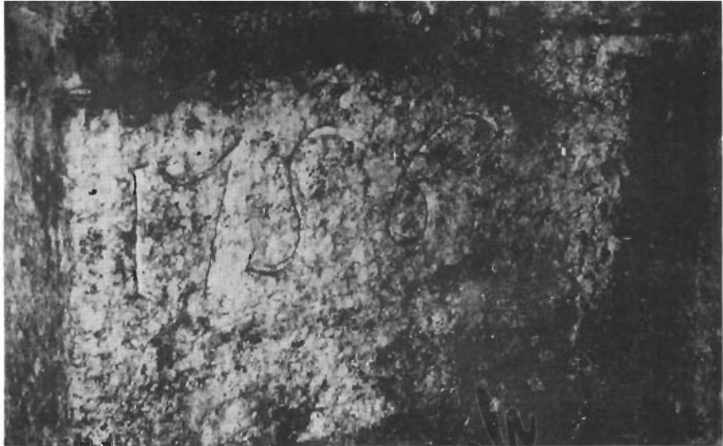
Galleria che attraversa il Viale della Rimembranza nel tratto a sud del Palazzo di Giustizia: il tratto Nord-Sud da Sud. La galleria attraversa il Viale della Rimembranza in senso normale alla strada (N-S), quindi gira sulla sinistra assumendo l'orientamento O-E. L'iscrizione sull'angolo destro dell'ingresso dalla stessa galleria. (Rif. 3)