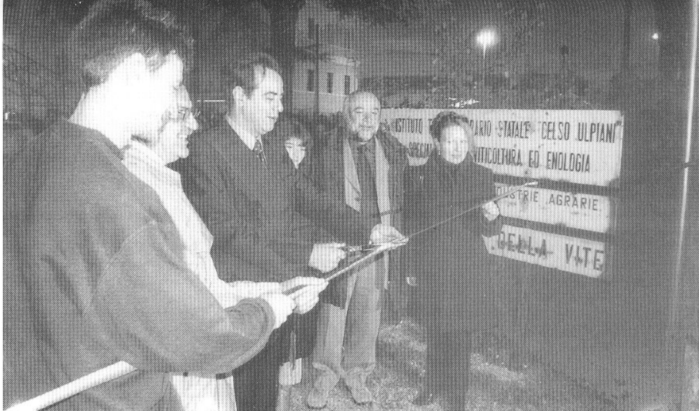
Sopra: Il Presidente della Provincia Pietro Colonnella, accompagnato dal Dirigente Scolastico dell'I.T.A. Marino Felicioni, procede al tradizionale taglio del nastro ■ Uno degli interventi d'apertura del Presidente Colonnella affiancato dal Preside Felicioni ■ Un momento della inaugurazione del Museo del Vino

L'Istituto Ulpiani fa anche parte della “rete” che collega gli istituti agrari ed enologici di tutta Europa, e, in ambito regionale, è l'unico costituente di cloni per la vite, cioè di piante che vengono selezionate per una determinata serie di caratteristiche morfologiche e produttive. Fabbrica di cultura e produttore agricolo, antesignano della sperimentazione e paladino della tradizione, agricoltore e industriale, poeta e scienziato l'ITAS è uno di quei preziosi gioielli che Ascoli custodisce quasi in segreto.