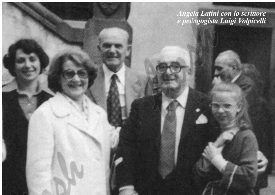
Angela Latini con lo scrittore e pedagogista Luigi Volpicelli