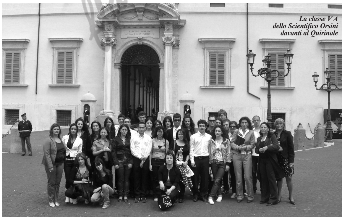
La classe V A dello Scientifico Orsini davanti al Quirinale