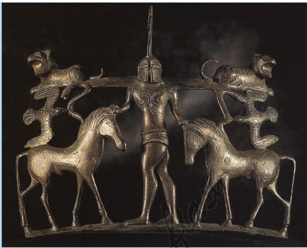
9 - Ansa di vaso di bronzo (Ancona, Museo Arch. Nazionale): sec.V. Ornamentazione di una coppia di cavalli e leoni che presenta al centro un guerriero con elmo di tipo corinzio. Ha un preziosismo quasi decadente.