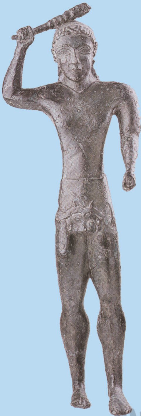
8 - Ercole di Castibellino (Ancona, Museo Arch. Nazionale): sec.V. Rappresenta il dio dell'assalto, che cinge ai fianchi la pelle del leone nemeo la cui testa gli copre il pube. Eccelle per vivacità e realismo sui molti esemplari, in genere di rozza fattura, che si trovano per lo più nei depositi votivi.