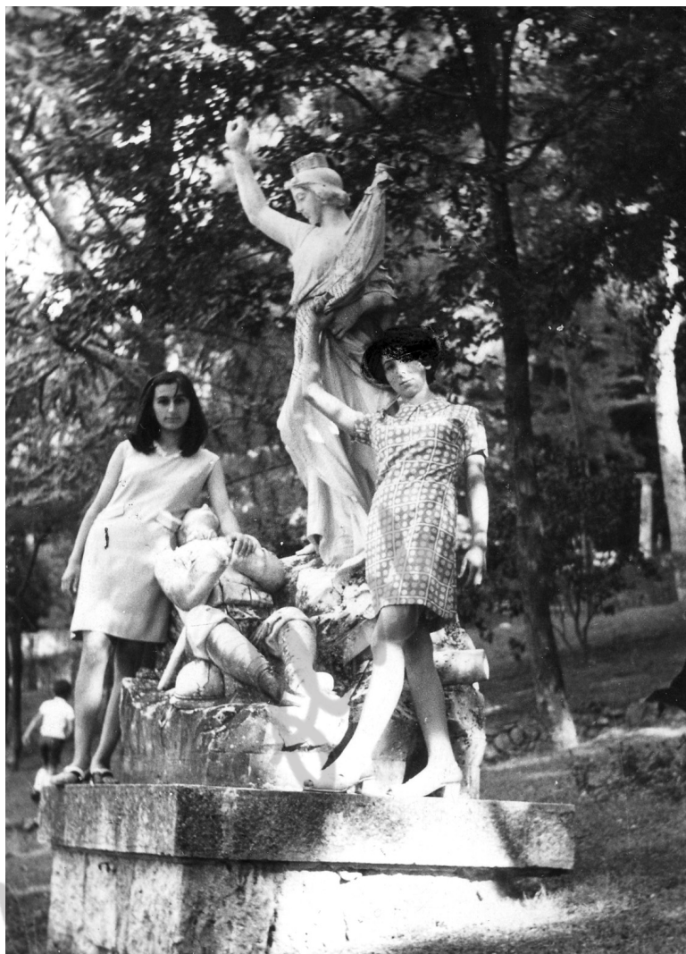
...una tenerissima statua che rappresenta la patria, dedicata ai caduti in guerra...