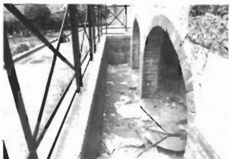
Tre foto molto significative: l'ingresso al ponte quasi interamente nascosto da manifesti - La ... scarica del Battistero - l'intasamento ed allagamento dei gabinetti pubblici.

to il loro amore per la terra tanto che in piazza si raggrumano, a formare un mucchio di letame, gli escrementi di cane. E poi ci sono le buche nelle strade dove si raduna l'acqua piovana; ci sono le vie dissecciate da otto mesi dove nasce la cicoria; ci sono "cessi" come stalle e ci sono "pentecane" come vitelli. Forti, irruenti, grintose e grasse che sembrano appartenere alla classe dirigente, nutrite dalle nostre fognie diabetiche. Ci vorrebbe, forse, una campagna di derattizzazione, ma il comune non ci pensa. Forse basterebbe pulire le fognie, rimettere in uso le vecchie pompe che lavavano la città.