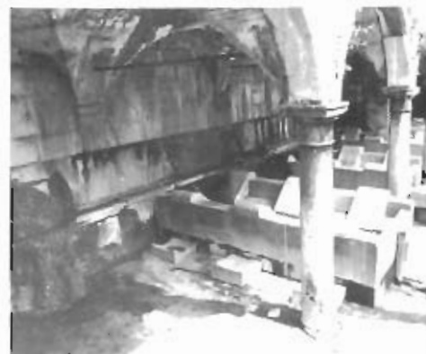
Lo stato fatiscente della fontana dell'acqua di S.Emidio

Insomma, il turismo ascolano è bello perché imprevedibile. Niente ordine; niente pulizia; niente programmi. Ognuno fa quello che vuole finché la bellezza