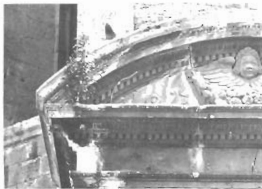
La chiesa di S.Venanzio (o S.Martino) in uno stato di completo abbandono - Sul'edicola di S.Francesco alberelli in fioritura.

Sotto c'era una bambina (si fa per dire) che faceva pipì, e lui non è rimasto per niente male e, come quello della tv, ha risposto al ciccone piccolo-piccolo, "Oh ja. Voi Italia dire acqua sant'Emidio, noi Germania dire altro modo", ed ha continuato il giro turistico.