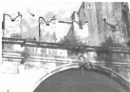
Il "giardino pensile" sulle Logge dei Mercanti.

te li senti sotto la scarpa sono quaglie calpestate nei prati. I riottosi e sofisticati storcono naso e bocca, ma non hanno capito niente. Quello fa parte del fascino antico, è la precisa "misura dell'uomo" e fa bene Cataldi ad andare a sventolare