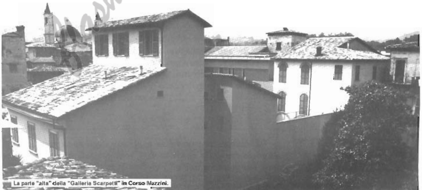
La parte "alta" della "Galleria Scarpetti" in Corso Mazzini.

COSTRUZIONI CIVILI E INDUSTRIALI • SPECIALIZZATO IN RESTAURI CONSERVATIVI