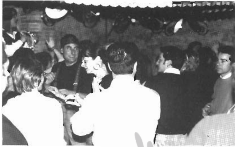
...con la "Chiara doppio malto ed il Quartetto Di Matteo, Viva la Rumba... viva la samba

gruppo "Il Pentagono". L'entusiasmo è stato indescrivibile: ragazzi che ballavano sui tavoli, cantì, balli e battute di mani hanno accompagnato il concerto per tutta la durata.