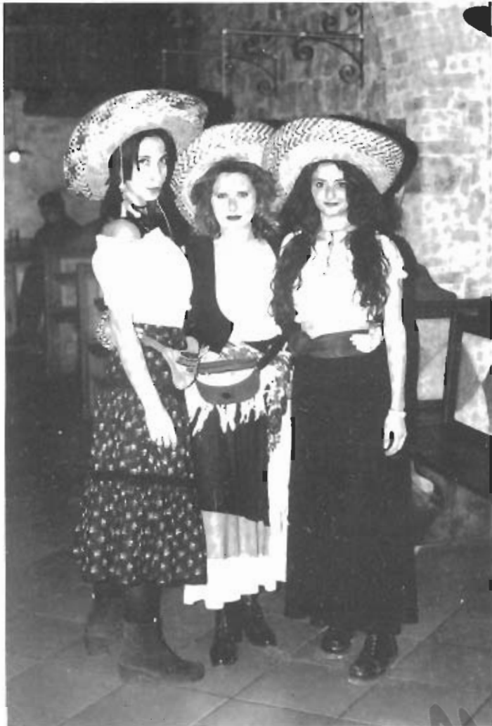
"Le peones" leopoldiane...